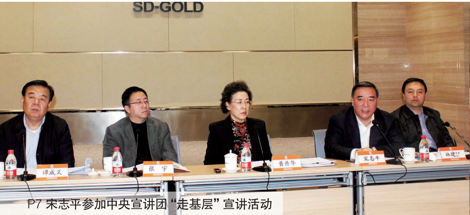
P7 宋志平参加中央宣讲团“走基层”宣讲活动